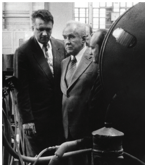
В Чехословакии на заводе Шкода с Председателем Совета Министров СССР Косыгиным А.Н.