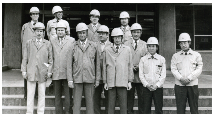
В Японии. Корпорация «Мицубиси», 1987 г.

водство по многим вопросам восходило к Генеральному секретарю ЦК КПСС. Можно было, например, собственными силами решить крупную проблему поставки запчастей для нефтедобывающей промышленности. Это ежегодно экономило бы огромные валютные средства страны. Вопрос был тщательно проработан, Величко доложил Горбачеву все материалы, но встретил настороженность и недоверие.