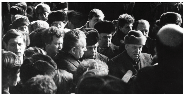
На заводе в Донецке. Приезд Генерального секретаря ЦК КПСС М.С. Горбачева, 1988 г.