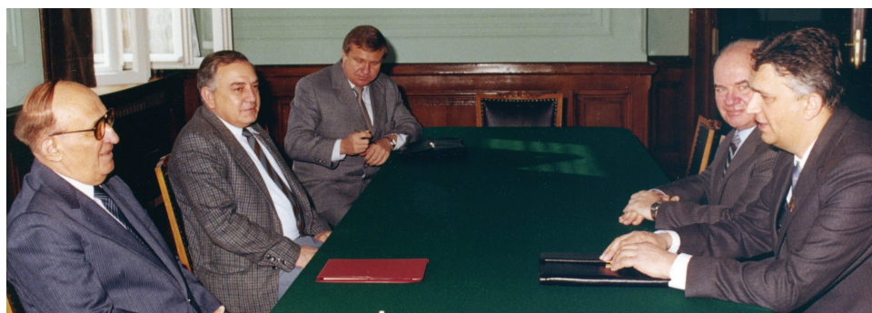
В Болгарии с Тодором Живковым (Генеральный секретарь ЦК Болгарской коммунистической партии), 1987 г.