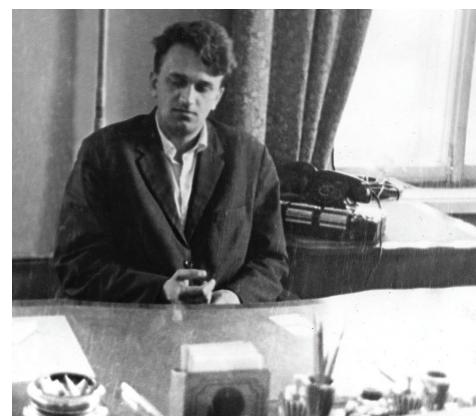
Заместитель начальника цеха, 1966 г.