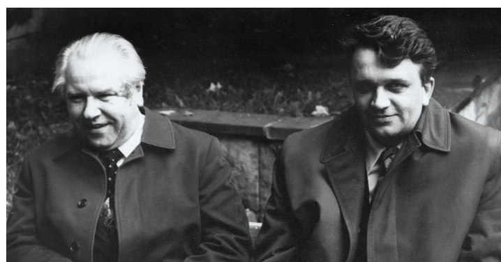
В Польше со Слюньковым Н.Н. — 1-м секретарем ЦК Компартии Белоруссии

Однако склонность к самоанализу помогла вовремя преодолеть «болезни большого руководителя». Примером во всех вопросах, в том числе этических, оставался Алексей Николаевич Косыгин. Перед каждым серьезным обсуждением какой-либо проблемы он с референтами во всем старался дойти до сути, до каждой мелочи, зато потом был во всеоружии, со специалистами разговаривал на равных, мог со знанием дела отчитать министра и при этом не повышал голоса, тем более никогда не кричал, — «вежливо» критиковал. Такой стиль не мог не сформироваться без большой внутренней культуры и компетентности человека, наделенного властью и ответственностью за эффективную работу правительства.