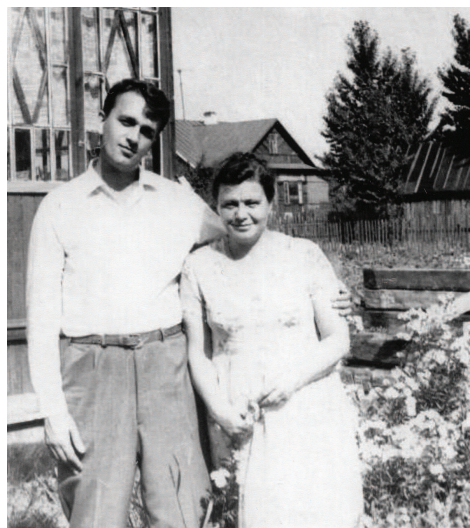
С мамой, 1974 г.

И музыка, и балет, и театр, и история, и книги на самые разные темы — все было интересно. Разбирала жажда знаний. Он как будто старался компенсировать недополученное, недоузнанное, недопрочитанное в детстве.