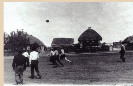
Деревня Ильинка, где пережили войну